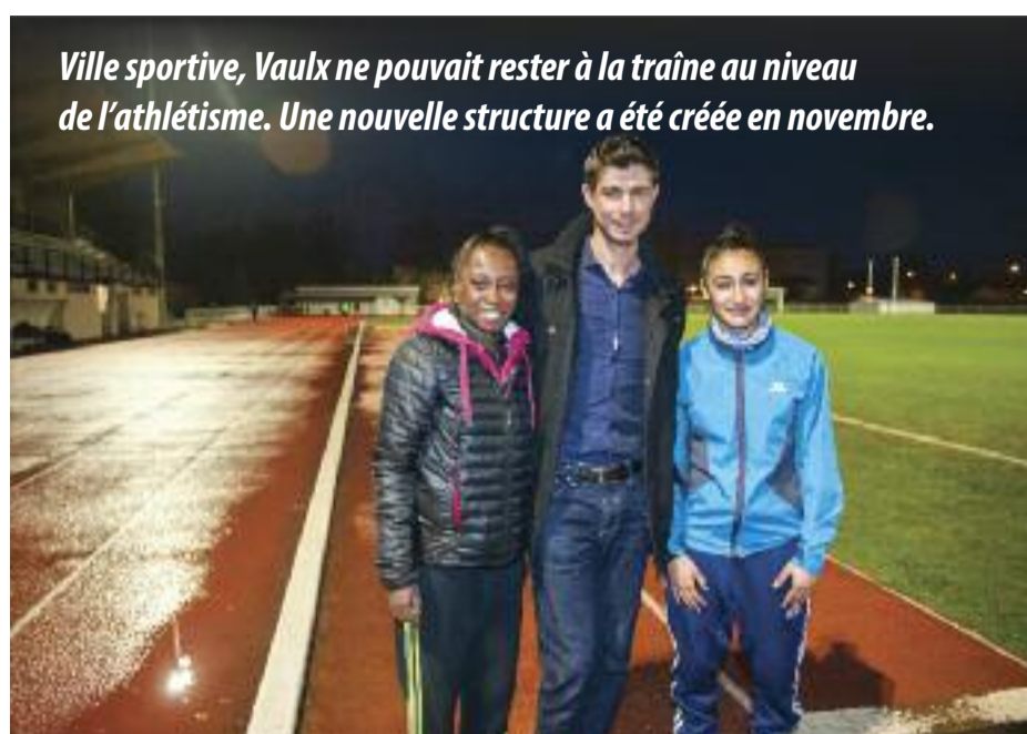
Ville sportive, Vaulx ne pouvait rester à la traîne au niveau de l'athlétisme. Une nouvelle structure a été créée en novembre.

Le VVA recense peu d'inscrits pour le moment. "Nous avons lancé notre association tardivement, explique la présidente. Des portes ouvertes ont déjà eu lieu en octobre 2015, ce qui nous a permis de sensibiliser des enfants. On cible particulièrement les 6-11 ans. Mais notre principale difficulté réside sur les équipements. La piste Rousseau n'est pas aux normes en vigueur pour s'entraîner". Ce pendant, une réflexion pour améliorer l'équipement a été amorcée avec le service municipal des Sports. Autre effort pour le nouveau club, obtenir la labellisation de la Fédération française d'athlétisme. Le dépôt du dossier est en cours et la structure a été reconnue par l'Office municipal des sports (OMS) vaudais. Le VVA intervient dans le cadre des activités périscolaires. Grâce à l'appui du DMA, un jeune en emploi d'avenir a pu être recruté et intervient dans les écoles. Le club participe aussi à la vie locale. La présidente anime