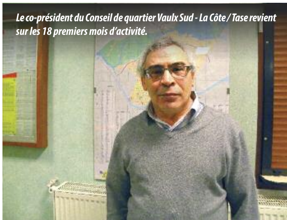
Le co-président du Conseil de quartier Vaulx Sud - La Côte / Tase revient sur les 18 premiers mois d'activité.

On constate une certaine lenteur pour obtenir des institutions des informations ou des réponses. On regrette aussi le manque de